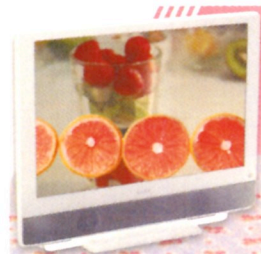
新液晶デジタルカラーTV13.3型